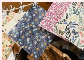
にじのわ 《みつろうエコラップ》 1500 円