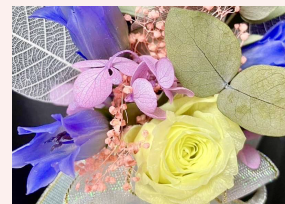
ひとひら工房 《フラワーアレンジメント》 1500 円