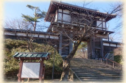
千秋公園表門(写真はイメージです)

◇予約方法: 駅たびコンシェルジュ秋田(JR 秋田駅2階【みどりの窓口】隣)にご来店、お電話 または下記ホームページからお申込みいただけます。