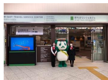
駅たびコンシェルジュ上野