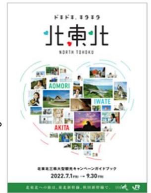
【キャンペーンガイドブック】